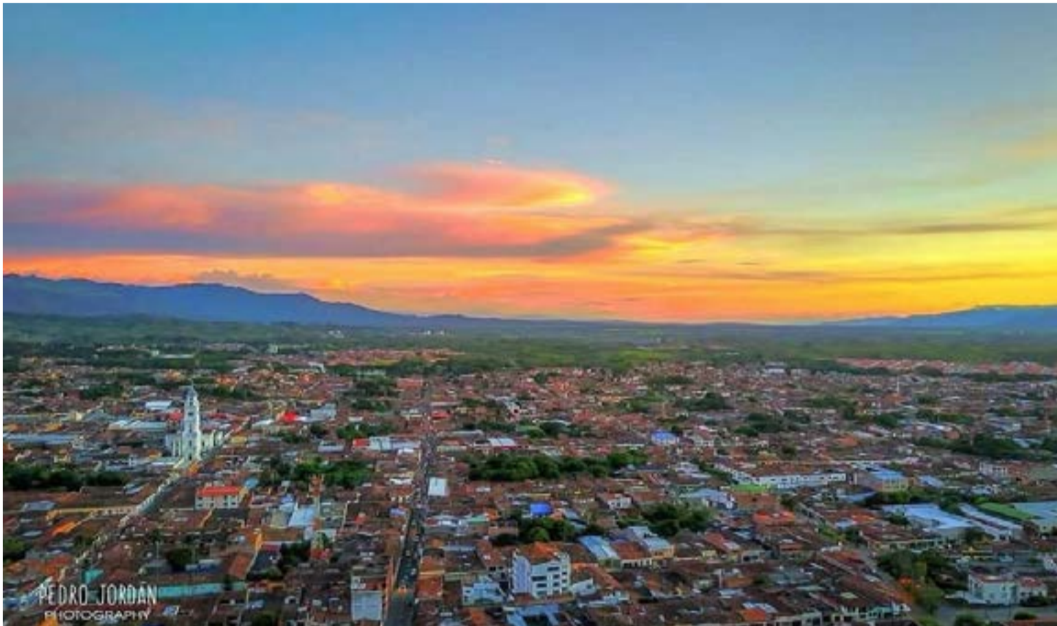
Cartago Valle del Cauca

Probablemente por ese olvido histórico o porque la civilización paisa borró el recuerdo y hasta lo rebautizó como el volcán del Ruiz pudieron haberse cometido las irresponsabilidades en Armero y Manizales que narro novelísticamente en la metáfora de los sordos que no oyeron las advertencias y hoy no hablan.