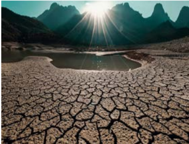
Las anomalías térmicas y el calentamiento de los océanos por gases de efecto invernadero han dejado de ser estacionales para volverse una constante estructural. Esta crisis altera drásticamente la dinámica atmosférica y las lluvias, acercando peligrosamente al planeta al límite de los 1,5°C establecidos en París.

Este fenómeno se sustenta, en primer lugar, en el efecto acumulativo de los Gases de Efecto Invernadero (GEI). Las concentraciones de dióxido de carbono ($CO_2$), metano ($CH_4$) y óxido nitroso ($N_2O$) no