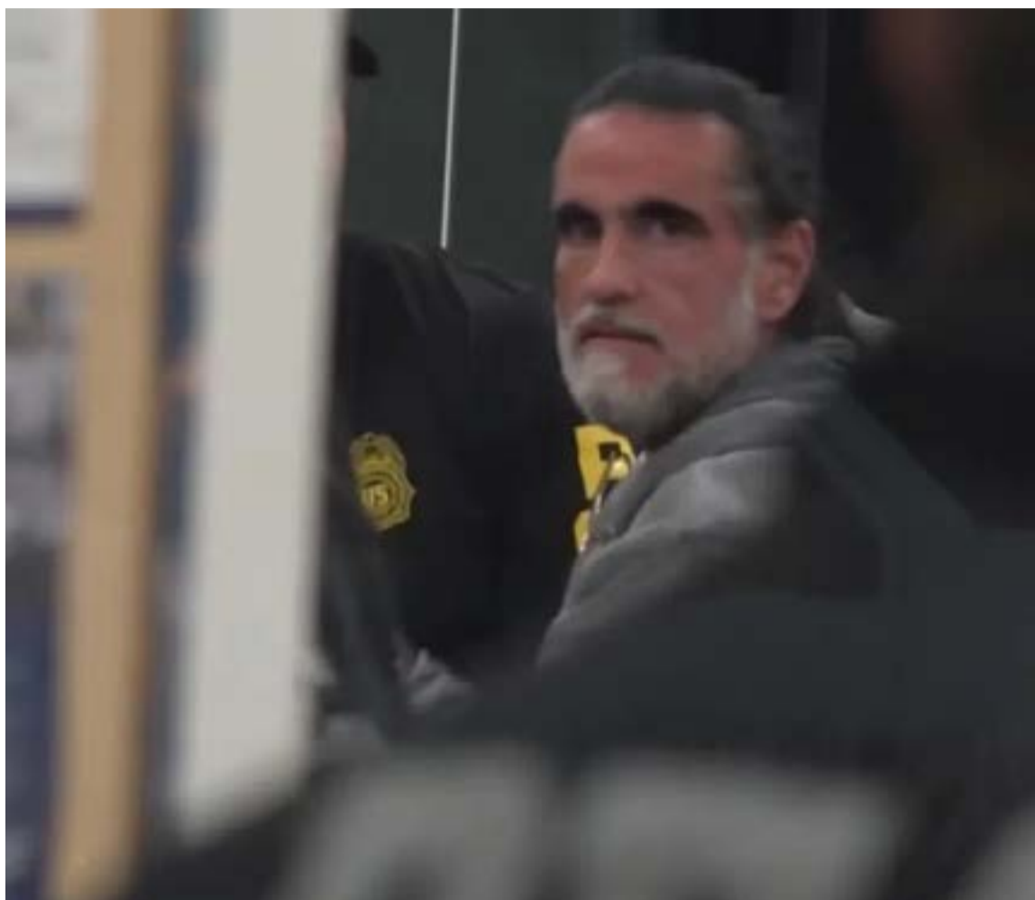
Alex Saab de retorno ante la justicia de los Estados Unidos