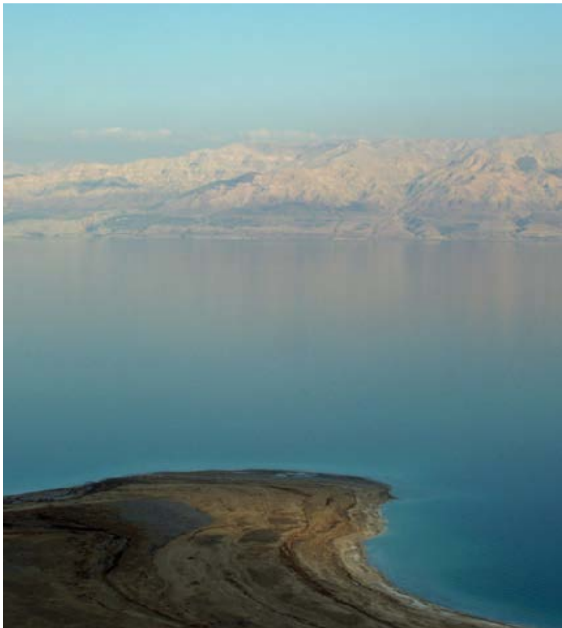
El Mar Muerto, también conocido como «Dead Sea», es un lago salado ubicado entre Jordania, Israel y Palestina, reconocido por ser el punto más bajo de la superficie terrestre. Su extrema salinidad impide que cualquier forma de vida marina prospere en sus aguas.

La característica más notable del Mar Muerto es su salinidad extrema, casi nueve veces superior a la de los océanos. Esta concentración de sal, resultado de la intensa evaporación sin salida al mar, es lo que le da a sus aguas una densidad tal que permite a las personas flotar sin esfuerzo alguno. Aunque su nombre sugiere la ausencia total de vida, es hogar de microorganismos capaces de sobrevivir en este entorno extremo.