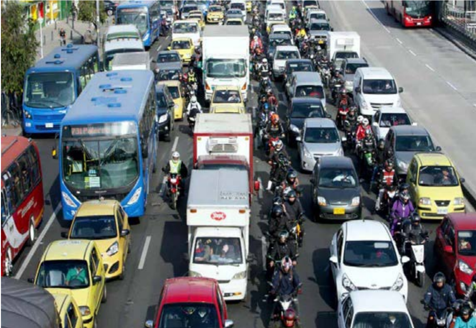
El colapso vial ha desatado una anarquía donde motos y bicis invaden los andenes ante el eterno trancón de una ciudad sin escape. Todo empeora por un TransMilenio deficitario que maltrata al usuario y un proyecto de metro diseñado solo para seguir enriqueciendo el negocio de los privados.

mentador de los buses rojos. Un negocio redondo estructurado, según los sectores más críticos, para seguir enriqueciendo a unos cuantos empresarios privados, funcionarios de turno, concejales y organismos de control que miran hacia otro lado.