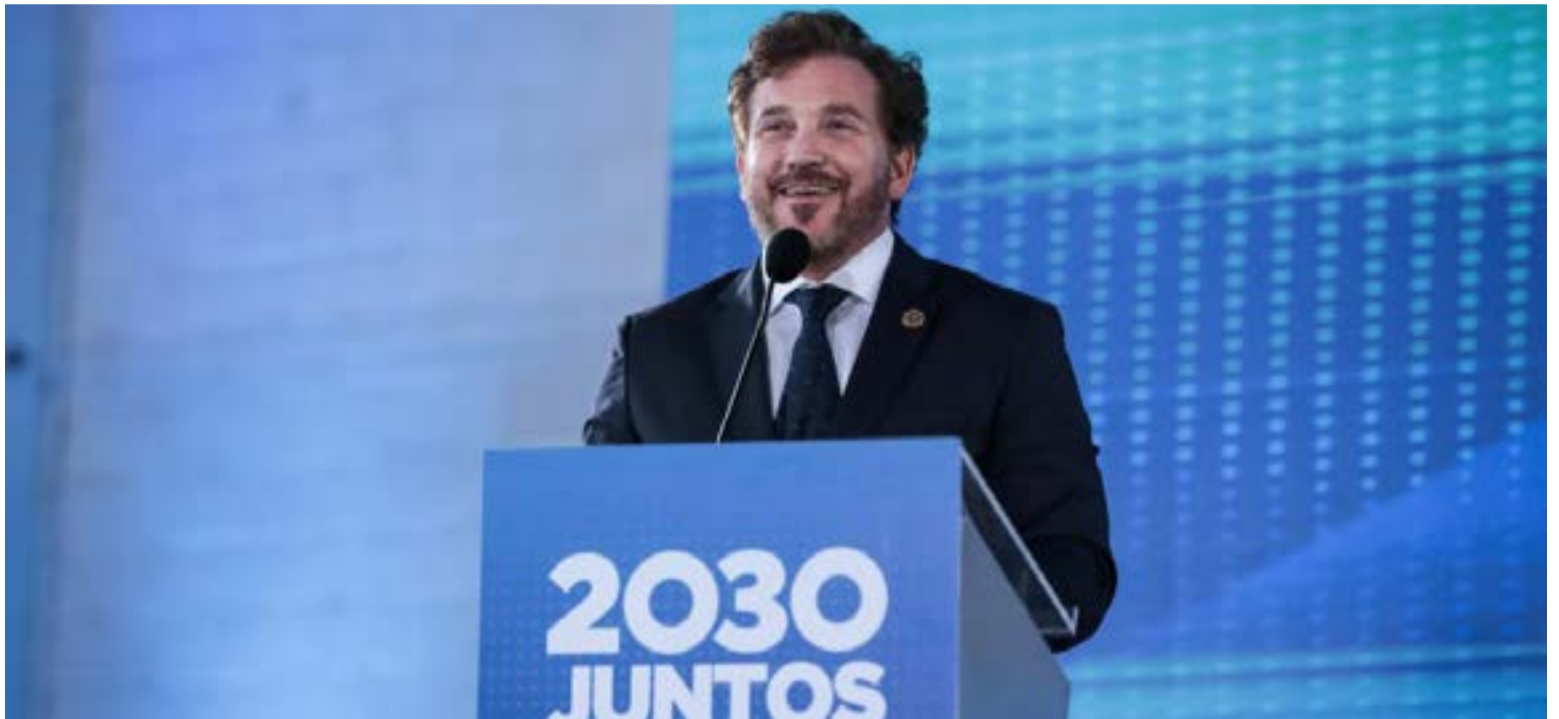
Alejandro Domínguez, de la Confederación Sudamericana de Fútbol («Conmebol») y vicepresidente de la Federación Internacional de Fútbol Asociación («FIFA»)