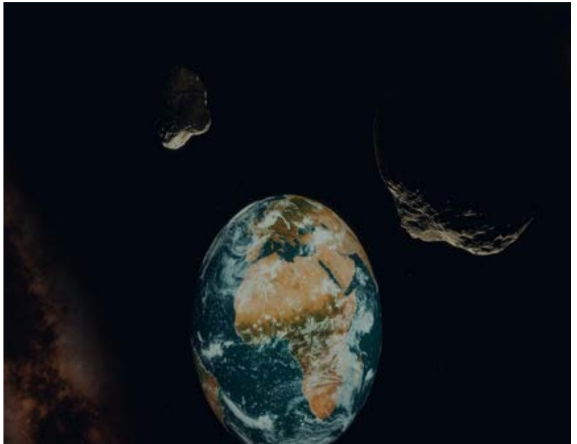
El vals de los asteroides: Un inusual doble tránsito rozará el vecindario terrestre

El bólido 2026 JH2 y su histórica aproximación: Avistado por primera vez