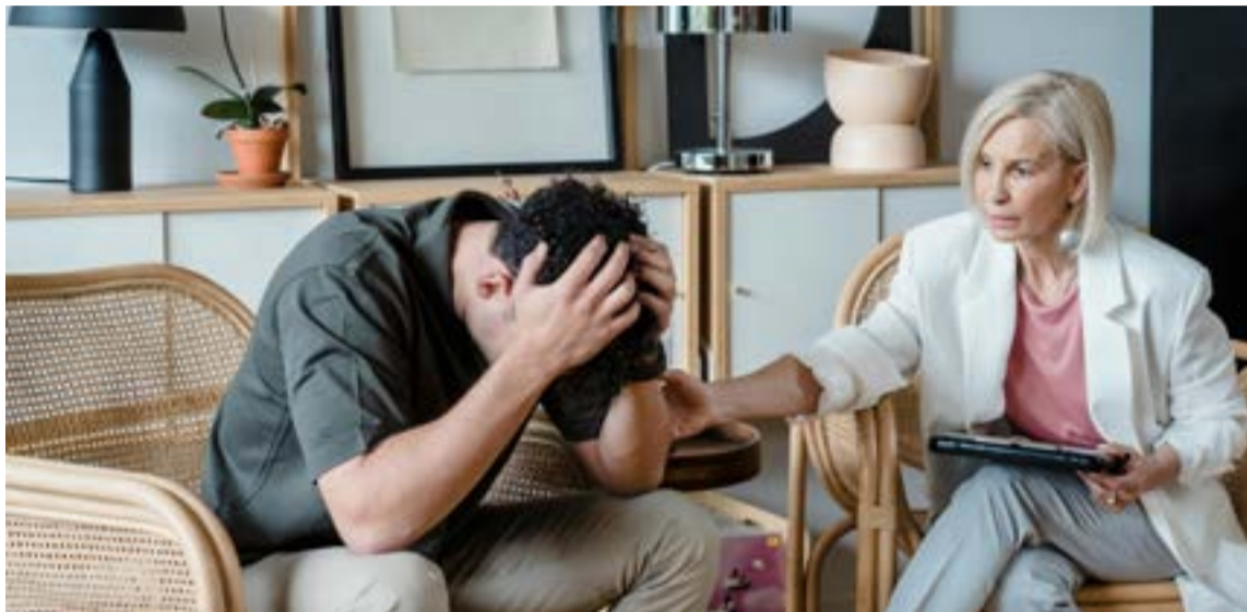
Los trastornos emocionales impactan todo el ciclo vital: el 50% de las patologías mentales inicia antes de los 18 años y el 14% afecta a los mayores de 60. La realidad más desgarradora se concentra en las nuevas generaciones, donde los jóvenes de 10 a 29 años representan el 72,9% de los intentos de suicidio.

Los trastornos emocionales no discriminan etapas del ciclo vital, manifestando dinámicas preocupantes desde la temprana edad. Los registros oficiales revelan que el 50% de las patologías mentales se desencadena antes de los 18 años, mientras que, en el extremo opuesto del espectro demográfico, el 14% de las personas mayores de 60 años convive con algún padecimiento de esta índole. Sin duda, la cifra más desgarradora se concentra en las nuevas generaciones: los jóvenes de entre 10 y 29 años representan el 72,9% de los intentos de suicidio en el territorio nacional. Las estadísticas del presente año exponen, además, una